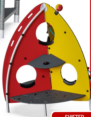
SHIFTER ARRAMPICATA 4'862,50 CHF

Attrezzature ludiche con struttura in acciaio inossidabile e zincato con elementi in corde EcoCore e superfici in polipropilene