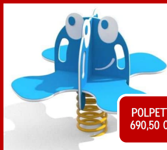
POLPETTA 690,50 CHF