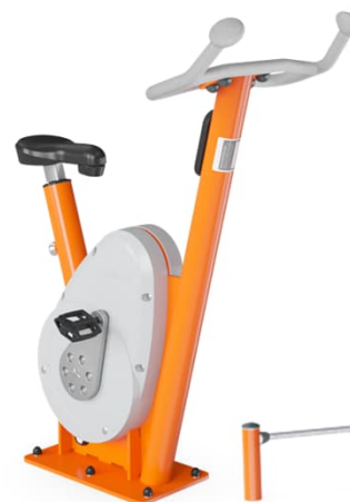
BIKE 3'687,50 CHF