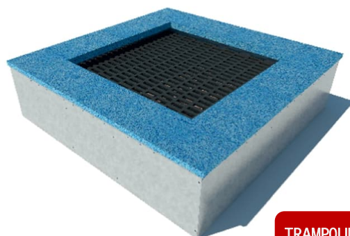
TRAMPOLINO 3'663,20 CHF