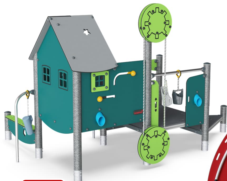
CASSETTA DI SABBIA 7'987,50 CHF