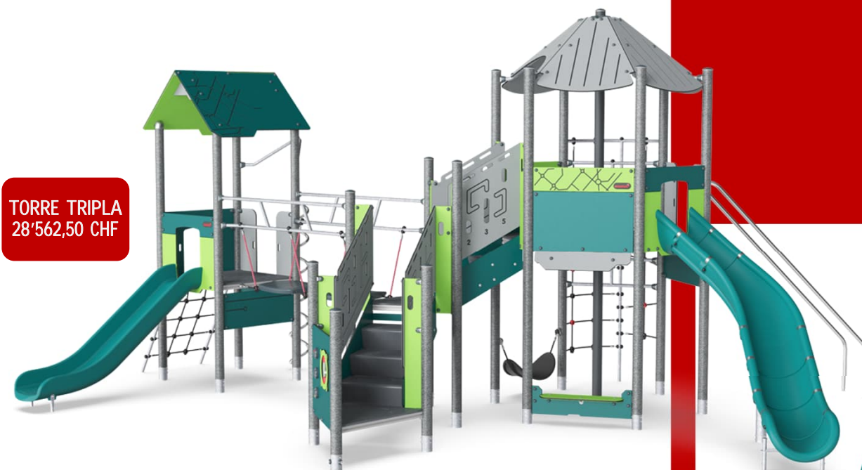
TORRE TRIPLA 28'562,50 CHF

Ufficio +41 918582117 nadia.balduzzi@isotech-ticino.ch giacomo.cannone@isotech-ticino.ch fabio.ciarmita@isotech-ticino.ch