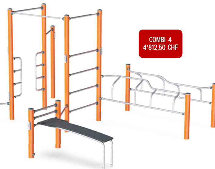
COMBI 4 4'812,50 CHF