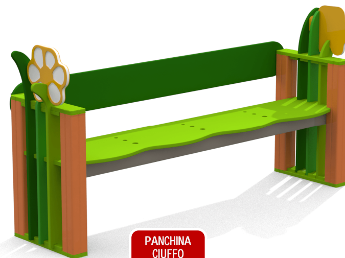
PANCHINA CIUFFO 675,00 CHF