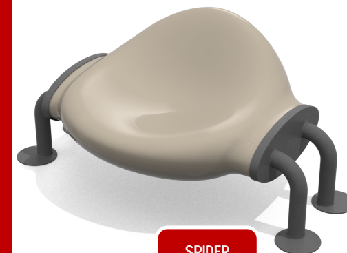
SPIDER 590,60 CHF

UN PARCO GIOCHI ANCHE PER I RAGAZZI PIU' GRANDI