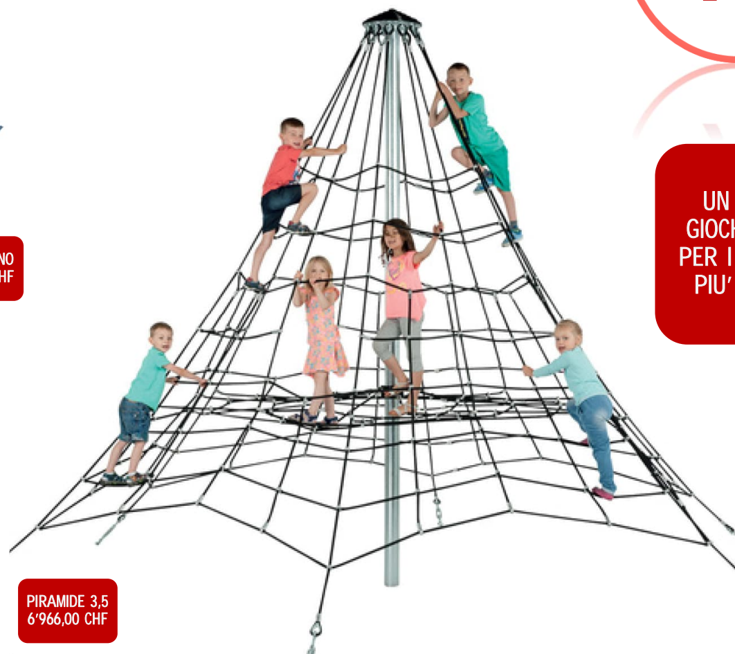
PIRAMIDE 3,5 6'966,00 CHF

Materiali con strutture in alluminio verniciato a polveri e telaio in acciaio zincato a caldo e verniciato a polveri. Pannelli in Polietilene HDPE 19mm con elementi in in Polietilene