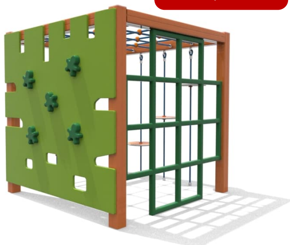
CUBO 4'282,90 CHF

Ufficio +41 918582117 nadia.balduzzi@isotech-ticino.ch giacomo.cannone@isotech-ticino.ch fabio.ciarmita@isotech-ticino.ch