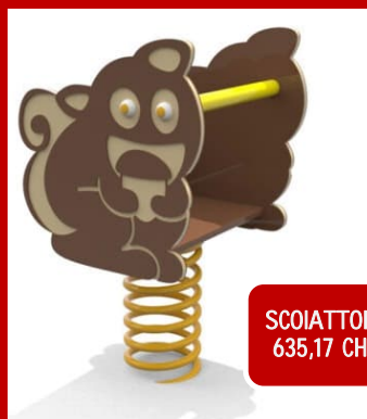
SCOIATTOLO 635,17 CHF

Materiali con strutture in alluminio verniciato a polveri e telaio in acciaio zincato a caldo e verniciato a polveri. Pannelli in Polietilene HDPE 19mm con elementi in in Polietilene