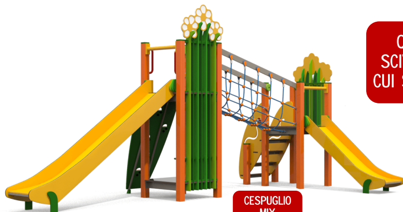
CESPUGLIO MIX 6'603,50 CHF