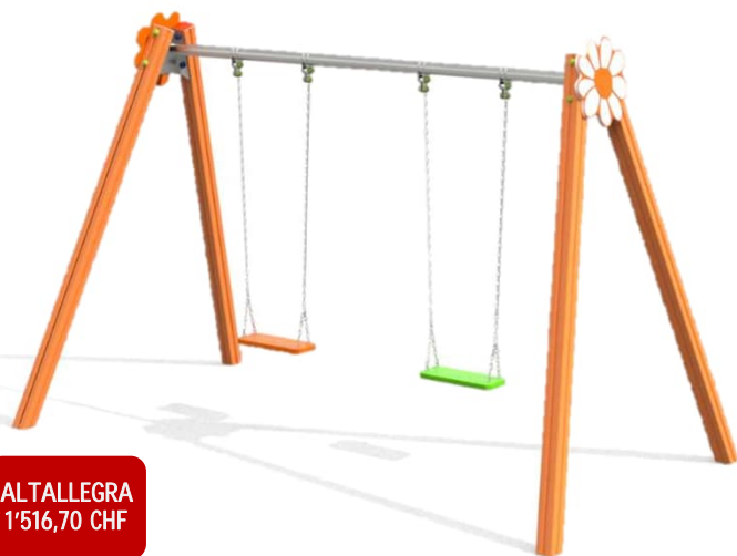
ALTALLEGRA 1'516,70 CHF

Escluse spese di trasporto e montaggio. Isotech si può occupare della posa, richiedi un preventivo. Escluso IVA.