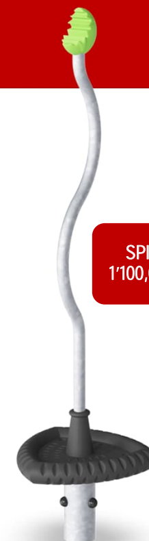
SPICA 1 1'100,00 CHF