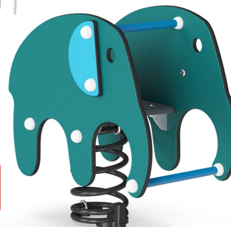
ELEFANTE 793,75 CHF

SET GIOCHI COMPLETO 30'456,25 CHF 29'000,00 CHF