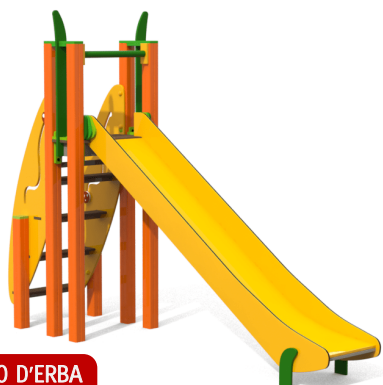
FILO D'ERBA PICCOLO 2'395,60 CHF